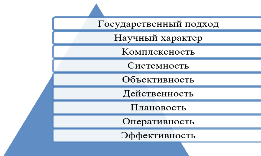
Рис. 2 Принципы комплексного экономического анализа 4

Проводя комплексный экономический анализ, необходимо руководствоваться определенными принципами, выработанными наукой и практикой, на рисунке 2 мы систематизировали их в единую схему, прежде всего это принципы: государственный подход, научный характер, комплексность, системность, объективность, действенность, плановость, оперативность, эффективность.