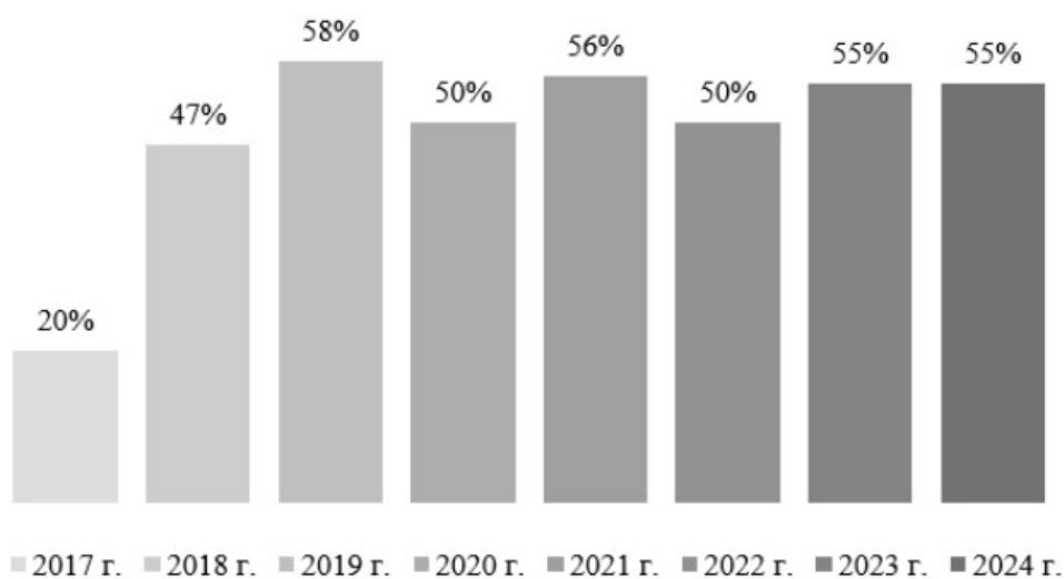
Рис. 1. Данные о доле российских компаний, использовавших искусственный интеллект в 2017-2024 г.

Сотрудничество между искусственным интеллектом и машинным обучением в бизнес-процессах, представленном на рисунке 2, имеет большое значение, так как они могут дополнять друг друга. В результате, предложенное авторами сотрудничество между искусственным интеллектом и машинным обучением позволит создавать более эффективные и точные системы, что в свою очередь способствует улучшению результатов и оптимизации бизнес-процессов в сфере сервисной деятельности.