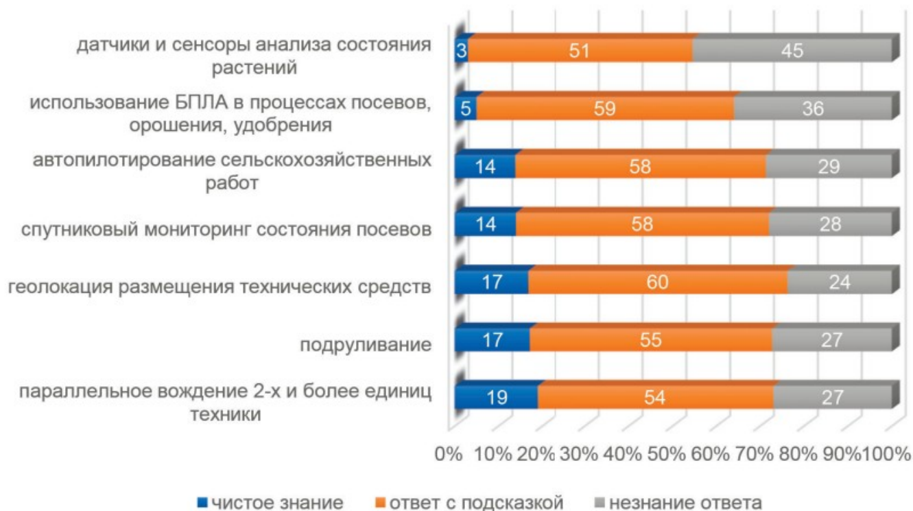
Рисунок 3. Осведомленность российских фермеров об инструментах умного земледелия в рамках цифровизации сферы АПК и использования механизма искусственного интеллекта за 2018 г.

опроса представителями Kleffmann Group стейкхолдеров из российских агробизнесов показала следующее