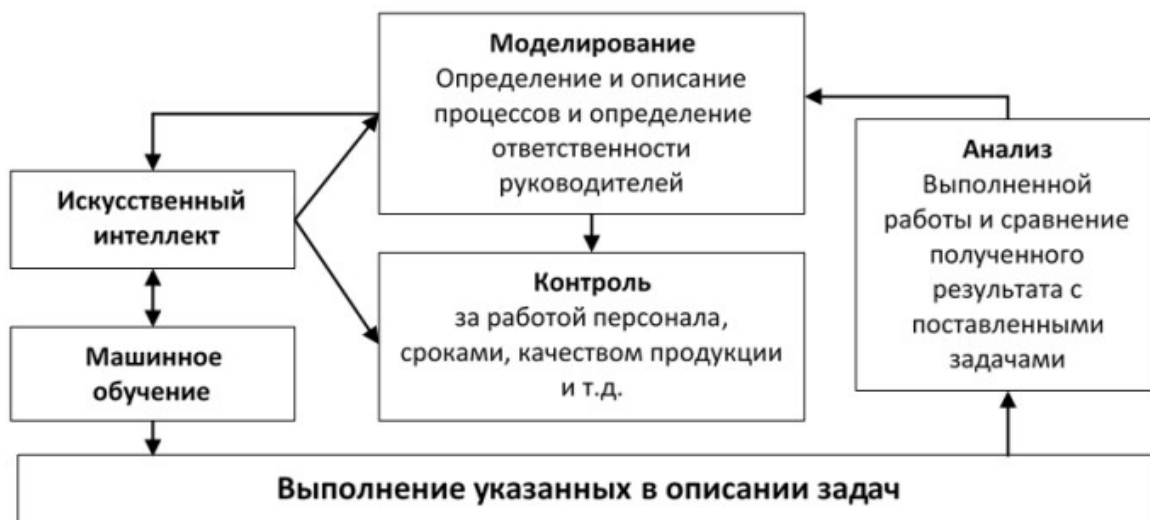
Рис. 2. Внедрение искусственного интеллекта и машинного обучения в бизнес-процесс управления сервисной деятельностью